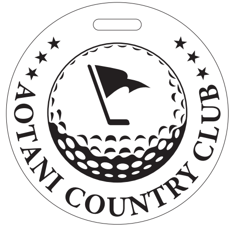
データ作成見本（丸形の場合）